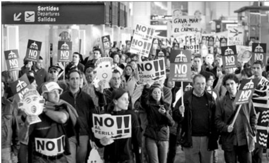
▶▶ Manifestació dels veïns de Gavà Mar, ahir, a l'aeroport del Prat.

PROTESTA CONTRA LA CONTAMINACIÓ ACÚSTICA AL BAIX LLOBREGAT